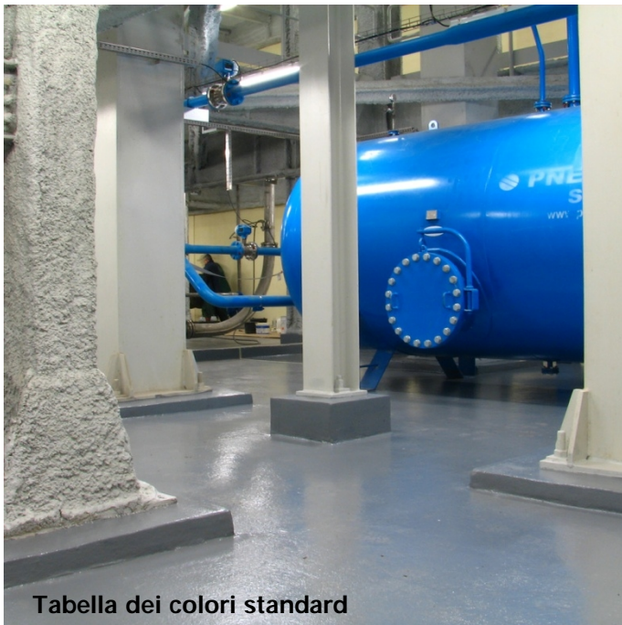
Tabella dei colori standard