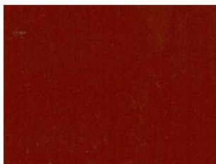
Rosso (vicino a RAL 3009)